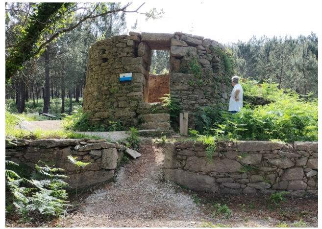
Posta en valor e acondicionamento da contorna da telleira do Roeiro (Vilar-Valga) 2023.