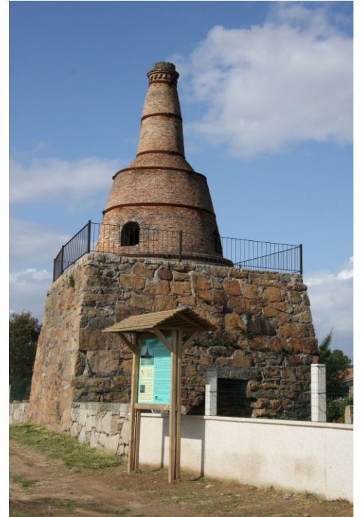
Telleira de Seixiños na actualidade.