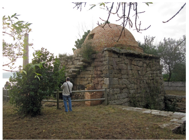
Rehabilitación da telleira de Vieites no Facho (Castrelo-Cambados).