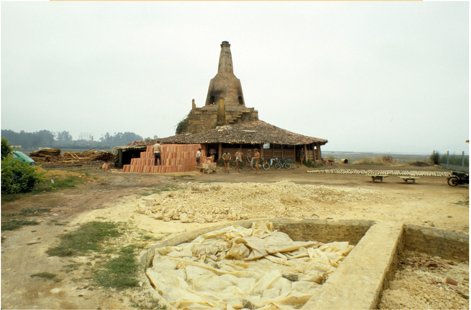
Telleira de Noia en Seixiños (Dena-Meaño). Imaxe do ano 1987, o último no que traballou.